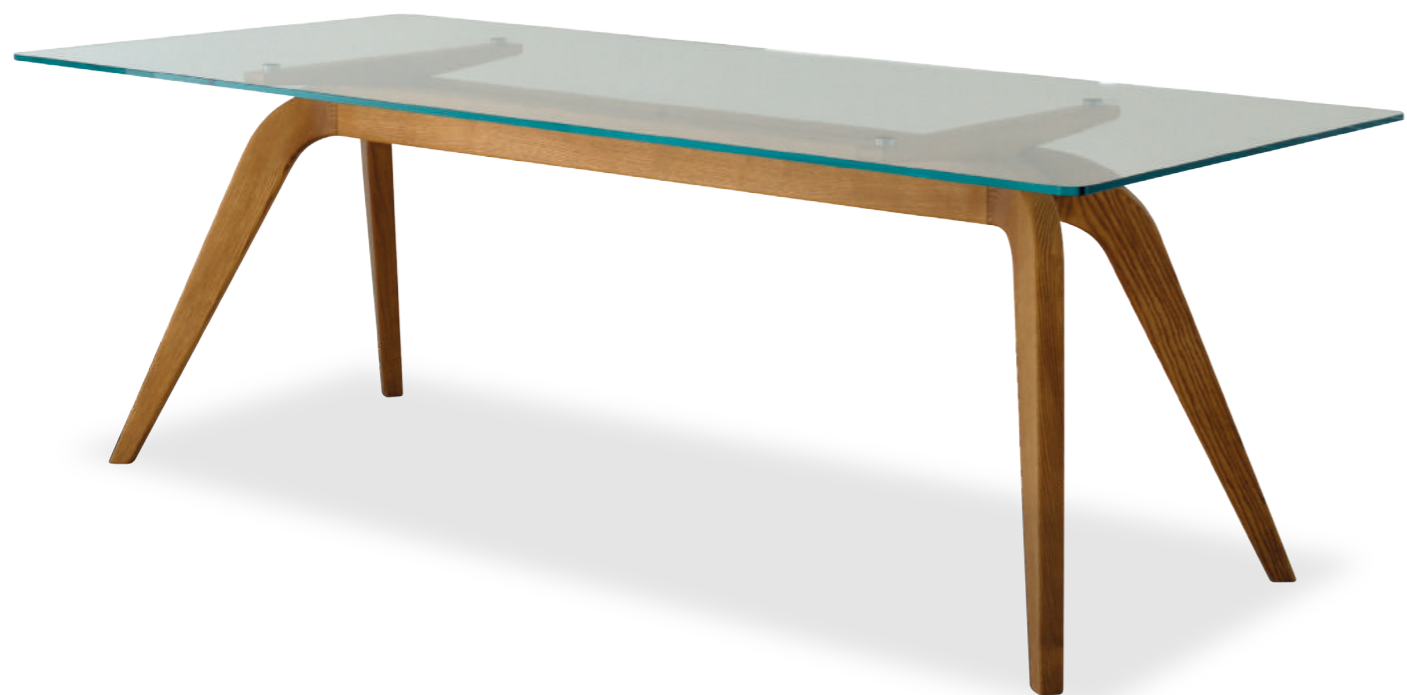
WOOD table design Studio Sagitair