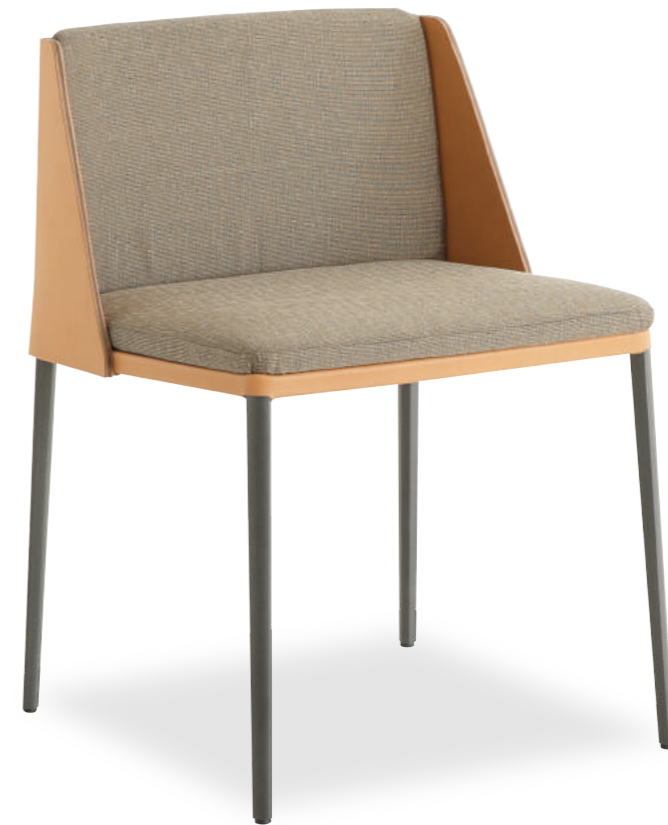
SELLARIUS chair design Stefano Grassi