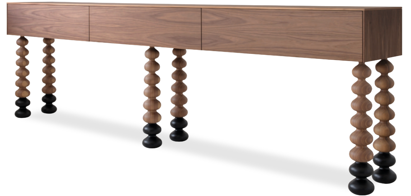
DILL sideboard design Gian Paolo Venier