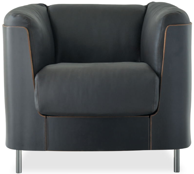
SELLARIUS armchair design Stefano Grassi