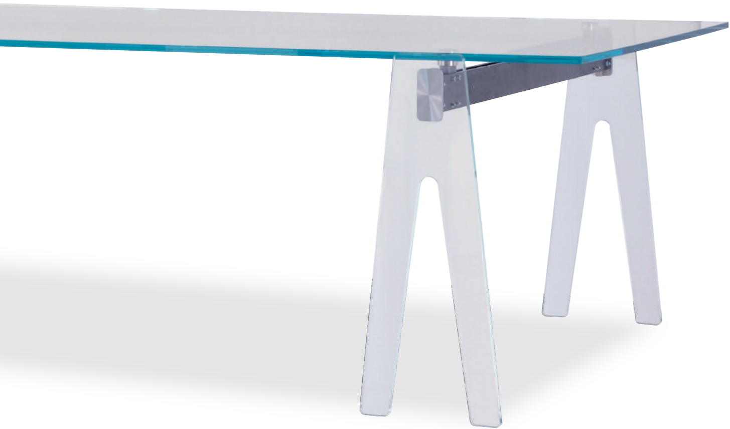
CLAMP table design Gian Paolo Venier