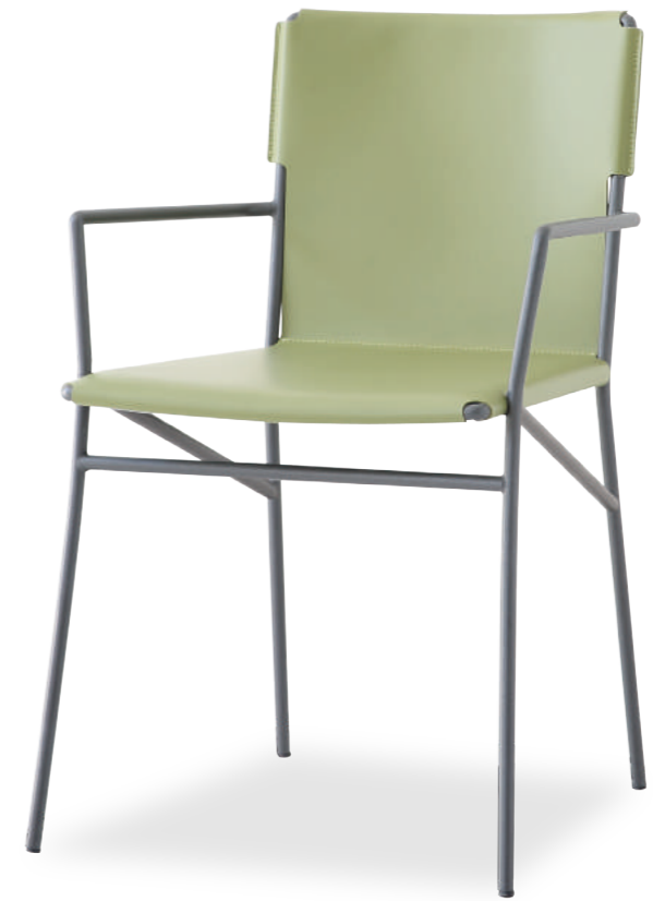
LAND chair design Daniele Molteni