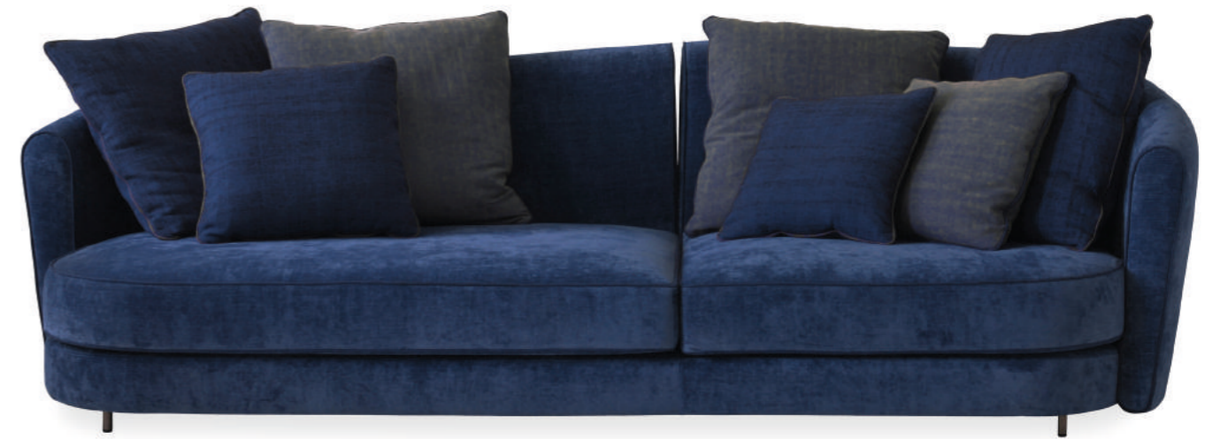
WES sofa design Gian Paolo Venier