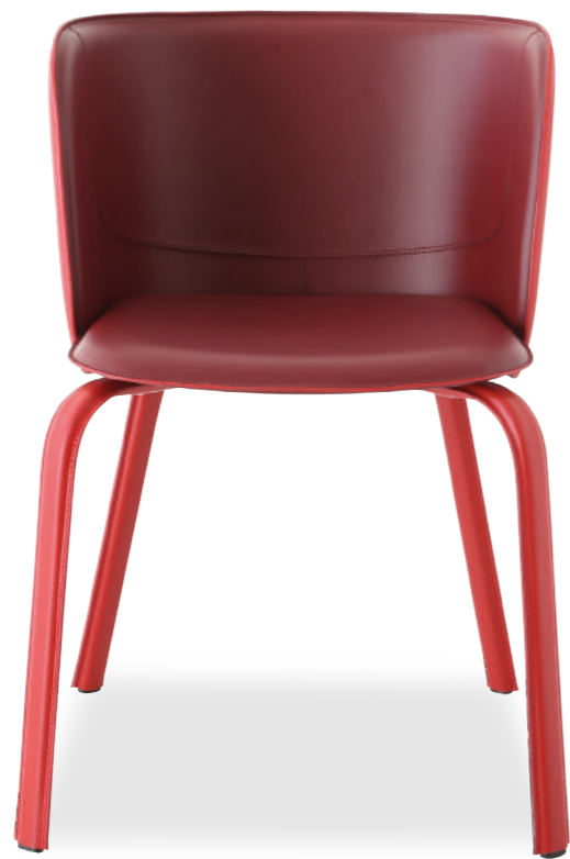
BELT armchair design Studio Memo