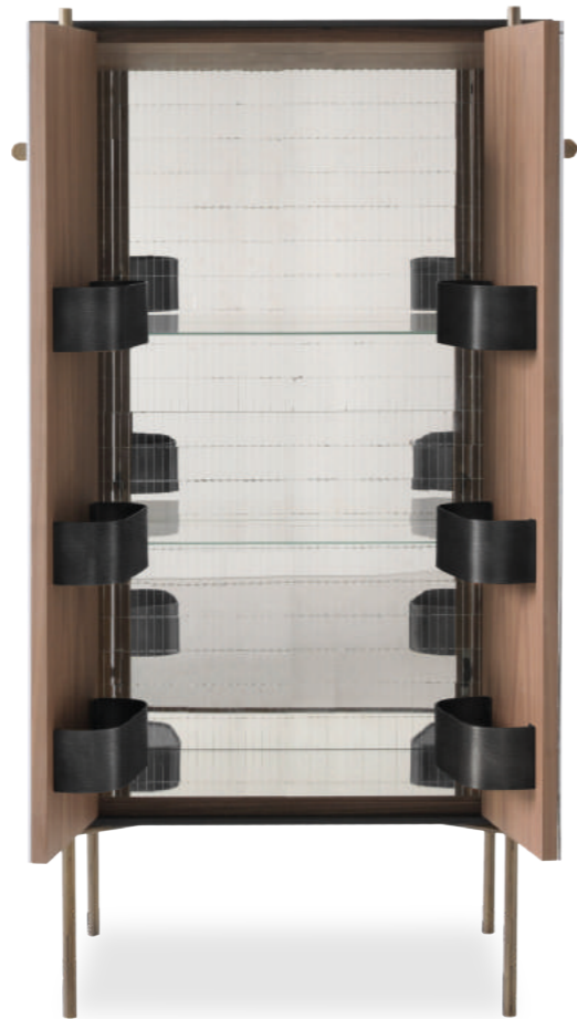
NELSON cabinet design Gian Paolo Venier