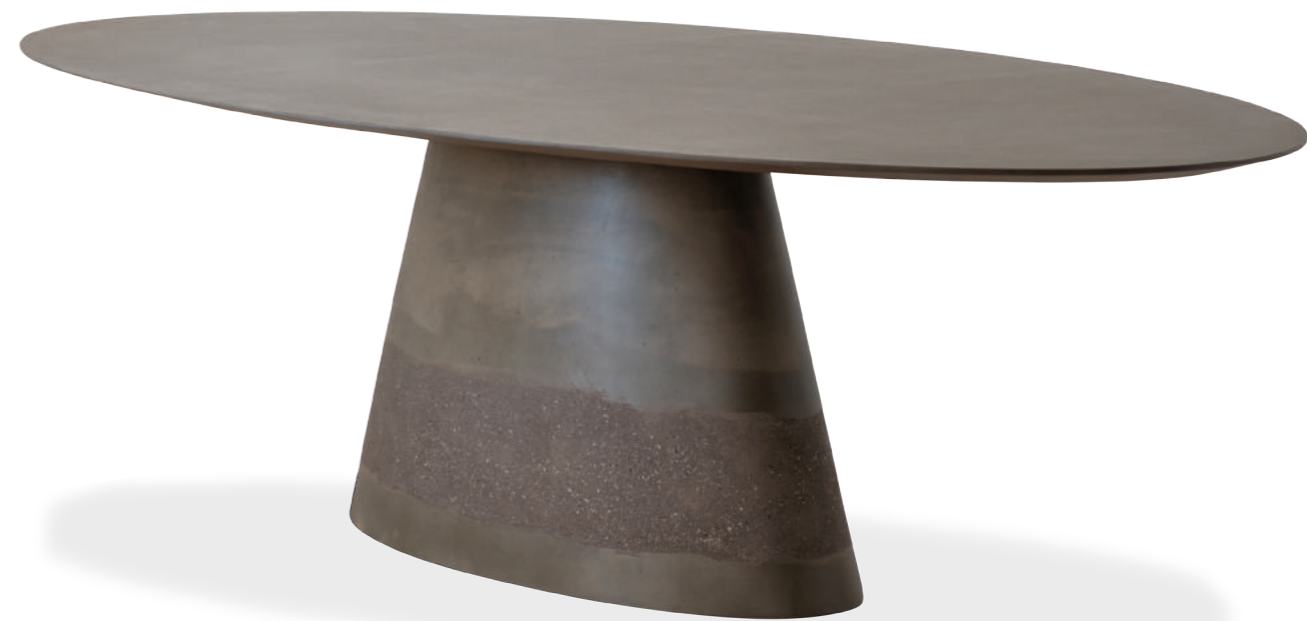
HALLEY table design Lino Codato