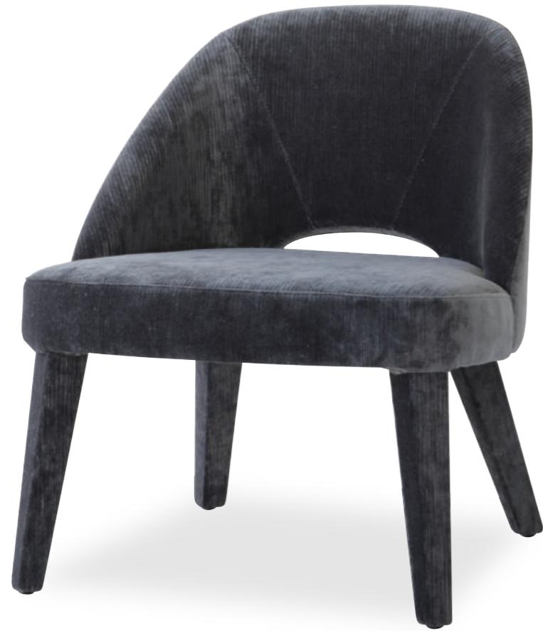
ALBA lounge design Dario Delpin